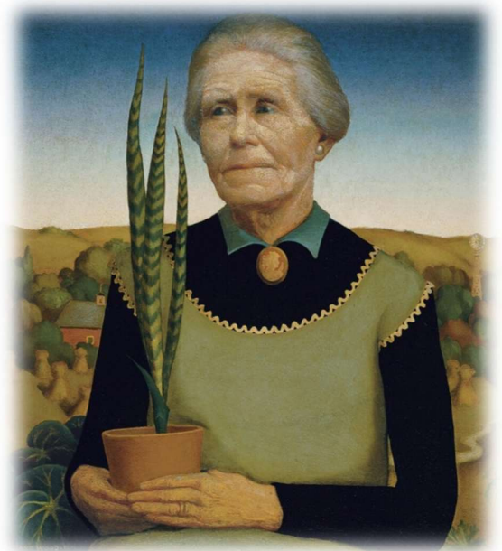
Femme aux plantes, 1929