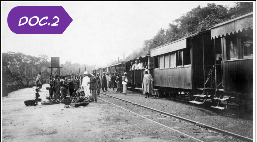
Train dans la Côte d'Ivoire coloniale (photo non datée).